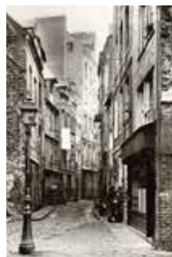
Rue Guillaume Le Testu, photographie par Raoul Laflot, 1908 (BM Le Havre). À gauche, mur de rebâtir en maçonnerie mis au jour par l'élargissement de la rue.

MARINE CONTRE COMMERCE 1408-1607 - LA MAISON, LA MAISON DE COMMERCE, LE FRAYLON