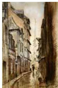
Rue d'Albarré, dessin aquatinté par H. Joussé, 1886, publié dans Les peintres au Havre, 2008.

dans leur entier en pierre, brique et cailloux. [...] Déclarés inutilisables tous les murs servant de séparation des maisons de ladite ville. » Le but étant au premier chef la lutte contre l'incendie, fours et cheminées sont réglementés.