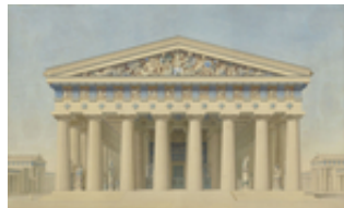
Jacques Ignace Hittorff Temple T à Sélinonte (Sicile)

Depuis les années 1970, de nombreuses études ont éclairé d'un jour nouveau, par des approches biographiques, institutionnelles, stylistiques ou typologiques, l'architecture du XIXe siècle, restée jusqu'à alors en grande partie méconnue.