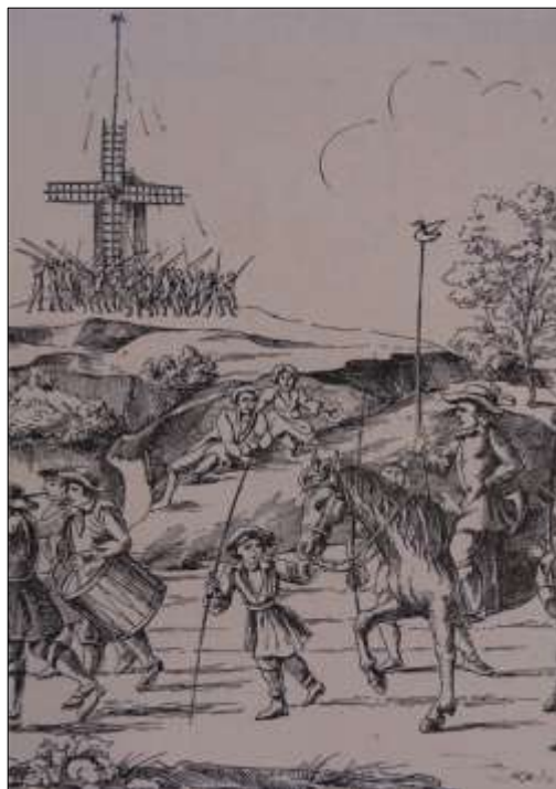
Fig. 3 – Le roi du papegay 9

La troisième partie de la thèse permet quant à elle d'apprécier les jeux et enjeux des pouvoirs à travers la stratégie de distinction et de conservation des droits et exemptions des membres de ces compagnies. Concrètement, elle s'intéresse dans un premier temps aux plaisirs curiaux reproduits dans les villes, dans les hôtels et jardins major aux compagnies des nobles amusements intérieurs des analysés, comme les jeux fêtes et les banquets. Les jardins, à la fois de lieux de promenade ville, mais également de lieux Cette partie s'intéresse également constante de privilèges et chevaliers, les abus commis par pour profiter du système, ou correspondances nombreuses Royaume pour partager aux acquis localement. Corps d'abord institutions municipales avant le XIV, les compagnies des nobles progressivement la protection de survivre. Car les villes remettent l'existence de ces compagnies et exemptions, qui n'ont dans la intérêt urbain que de rehausser urbaines.