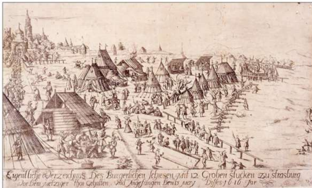
Concours de tir au canon, Strasbourg (5 mai 1616) 8